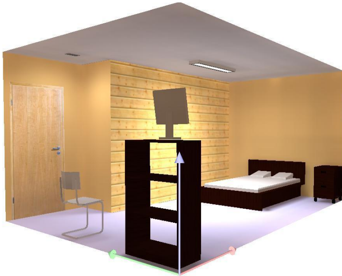
Diseño iluminación en un cuarto con software Dialux

Buena Energía S.A.S diseña proyectos de corto, mediano y largo plazo que tienen un impacto positivo al reducir el consumo de electricidad, enfocándose en el mantenimiento correctivo y preventivo de equipos de alto consumo energético, neveras, bombas, lavadoras, etc. Y en un diseño adecuado de iluminación.